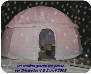
Un souffle glacial est passé sur Dhuisy les 4 & 5 avril 2008

Comme chaque année depuis maintenant 7 ans, Les Scènes Rurales se sont produites à DHUISY.